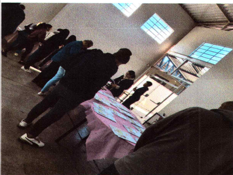
Café com Afeto