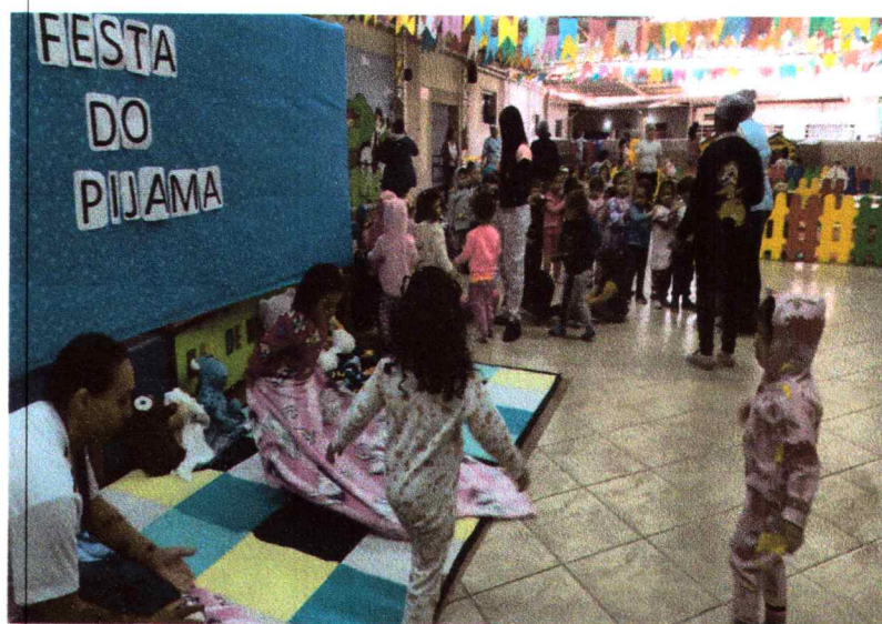
Festa cultural – família presente