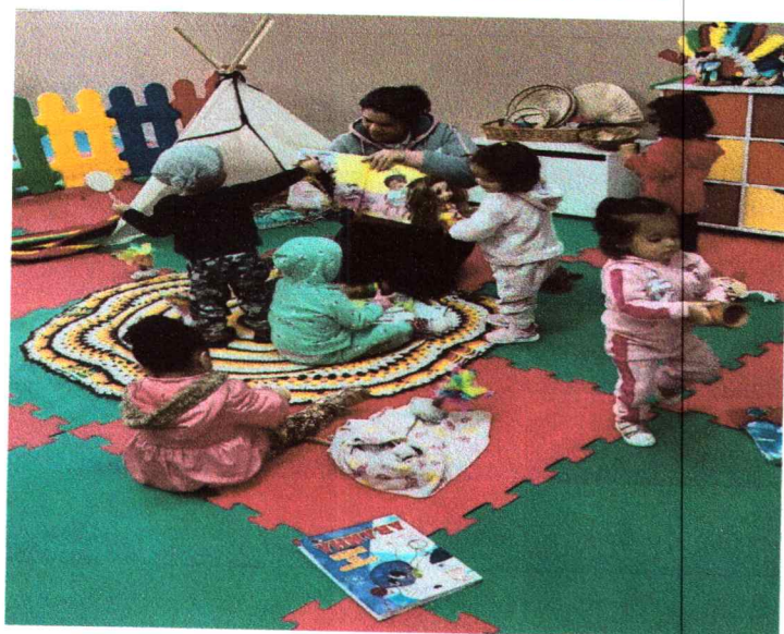
Cantinho da diversidade